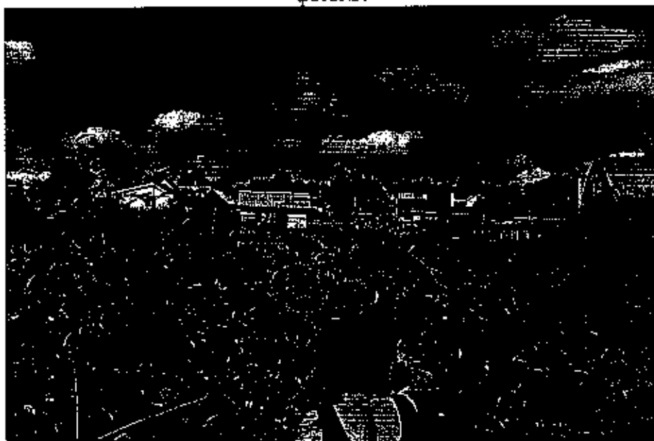
фото № 5

Ведущий специалист отдела экологии, природных ресурсов и земельного контроля Контрольного управления администрации м.р. Сергиевский