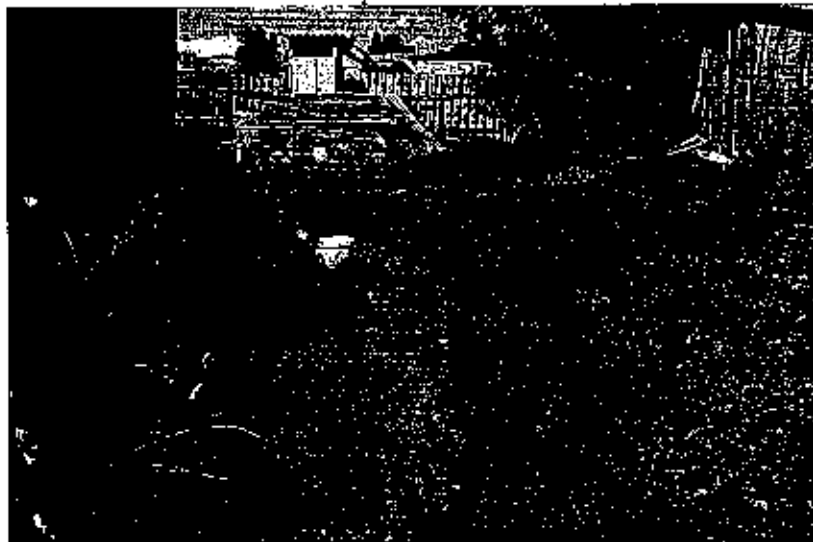
фото № 4